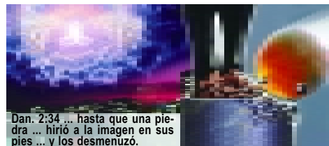
Dan. 2:34 ... hasta que una piedra ... hirió a la imagen en sus pies ... y los desmenuó.

El profeta Daniel vio que en aquel tiempo cuando el hombre tratara de unir las Naciones de Europa y el mundo sería visitado cada vez más por catástrofes y guerras; una gran piedra chocará a la imagen en los pies y la destruirá por completo. Esa piedra representa la 2ª Venida de Jesucristo (Dan. 2:34-35, 44; Salmos 18:31). Cristo pronto volverá sobre las nubes del cielo con sus ángeles, visible para toda la humanidad (Ap. 1:7). A favor de preparar a la especie humana para este evento y ayudarla a estar en pie durante el juicio; Dios, en su gran amor, advierte a la humanidad con un último mensaje de gracia que se encuentra en Apocalipsis 14:6-12.